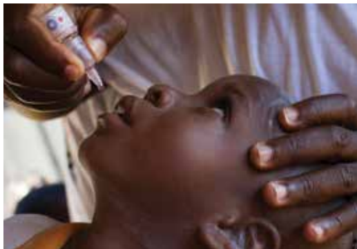
扶輪社員在奈及利亞，為兒童投小兒麻痺疫苗。

扶輪社員和友人的慷慨捐獻讓我們為有需求的社區提供有持續性的改善。如您有意支援扶輪基金會，請詢問貴社的扶輪基金會主委，或者上網 rotary.org/donate 瞭解方法。更多的詳情可自 The Rotary Foundation Reference Guide (扶輪基金會參考指南) 下載，或在扶輪網站的 Learning Center (學習中心) 學習有關扶輪基金會的基礎課程。